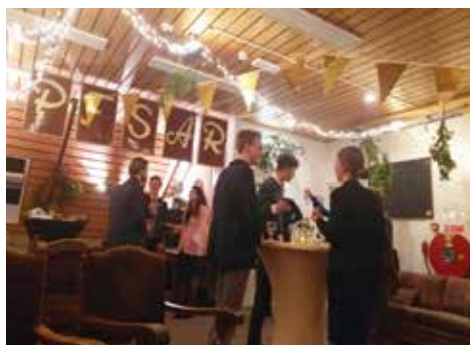
Beeld van de oude studentenzolder.

De 'operatiekamer', of: de 'tandartspraktijk'. Zo omschrijven sommige studenten de vernieuwde studentenzolder - vanouds de 'Areopagus' genoemd - vanwege de wat steriele uitstraling die het studentenverblijf