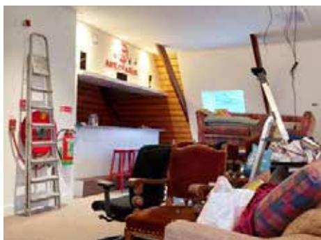
De Areopagus ten tijde van de werkzaamheden.

De 'operatiekamer', of: de 'tandartspraktijk'. Zo omschrijven sommige studenten de vernieuwde studentenzolder - vanouds de 'Areopagus' genoemd - vanwege de wat steriele uitstraling die het studentenverblijf