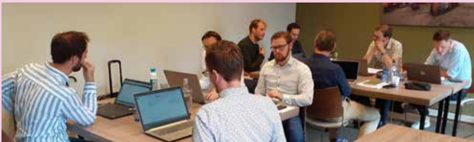
De studenten bijeen tijdens het laatstgehouden preekseminar.

Elk najaar gaan een aantal masterstudenten geheel vrijwillig op 'retraite', zoals dat volgens de jaargenda van de TUA wordt genoemd. Dit zou wellicht de indruk kunnen wekken dat het hier om een snoepreisje gaat, doch het tegendeel is het geval. Hoewel we afgelopen najaar, toen we deze retraite hadden, heerlijk konden eten en er ruimte was voor ontspanning, waren het intensieve dagen. We werden onderwezen en gaven elkaar onderwijs wanneer we elkaars preken bespraken en bekritisierden. Vooraf maakten we allemaal twee preken over Hosea 3:5 en Handelingen 8:8. Daarnaast moesten we een preekschets maken over de Heidelbergse Catechismus, Zondag 44. De bespreking hiervan leverde hier en daar wat vragen op, die we met elkaar niet altijd