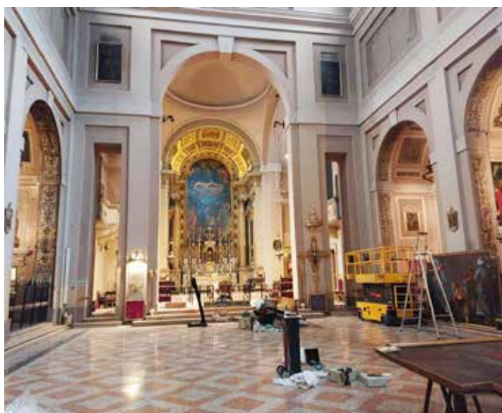
Blik in de kerk van Bologna.

Voorwaarde is wel dat elke morgen met publieke lezing uit de Bijbel en met gebed begonnen wordt en de kerk intact blijft om ook voor erediensten gebruikt te kunnen worden. Een deur tussen kerk en Fscire bestond gelukkig al. Het is prachtig te zien hoe hier geloof en wetenschap verbonden worden en hoe wetenschappers en bedelaars onder hetzelfde dak zitten. Twee dingen vielen mij bijzonder op: het orgel dat zonder organist maar via een app bespeeld kan worden, en een Christusbeeld met een kleed van aluminiumfolie, zoals bootvluchtelingen die om krijgen zodra er hulp voor hen is.