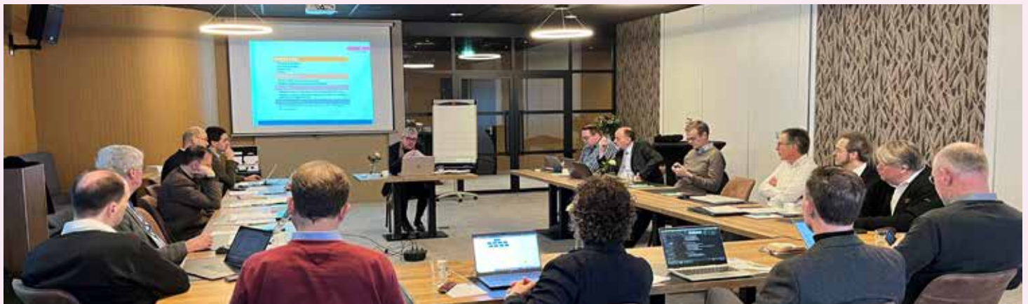
Onderzoekers van de TUA waren twee dagen bijeen in Zwartsluis voor het maken van onderzoeksplannen.