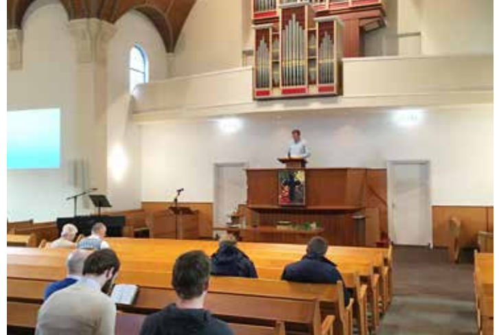
Studenten oefenen het preken in de dicht bij de TUA gelegen Barnabaskerk.

Naast allerlei praktische zaken komen vooral fundamentele vragen aan de orde. In een gereformeerde theologie is nog altijd de