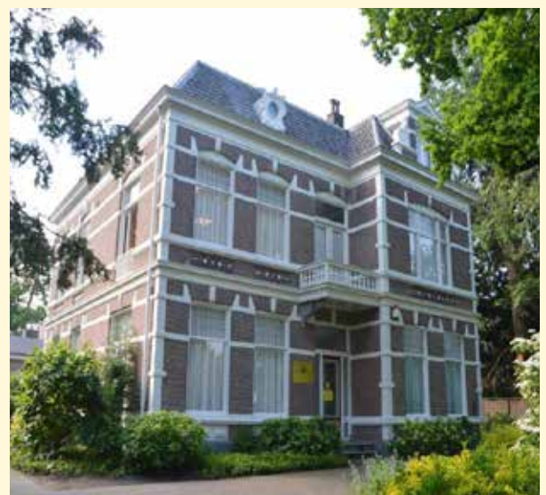
Het resultaat. Het nieuwe dak kan weer vele jaren mee.

Afgelopen voorjaar heeft het oudste TUA-gebouw (de voormalige villa) een nieuw dak gekregen. Deze grote klus was hard nodig, want voor een groot deel stamde het oude dak nog uit de negentiende eeuw. Het zink was niet goed meer, de panlatten waren deels verrot, de lasnaden van het lood lieten los en er waren scheurtjes ontstaan. Ook de dakgoten bleken aan vernieuwing toe te zijn. Kortom, het hele dak moest eraf. De werkzaamheden hebben al met al enkele maanden in beslag genomen, maar nu ziet alles er weer goed uit. De buitenkant is voor het oog in dezelfde staat gebleven, omdat het gebouw een beschermd stadsmonument is. Met het nieuwe dak is het gebouw weer bestand tegen allerlei weersinvloeden en kan het weer vele jaren mee.