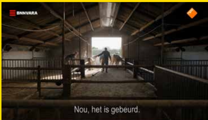
Beeld uit genoemde documentaire.