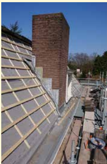
De werkzaamheden in volle gang. Gelukkig bij mooi weer!

Afgelopen voorjaar heeft het oudste TUA-gebouw (de voormalige villa) een nieuw dak gekregen. Deze grote klus was hard nodig, want voor een groot deel stamde het oude dak nog uit de negentiende eeuw. Het zink was niet goed meer, de panlatten waren deels verrot, de lasnaden van het lood lieten los en er waren scheurtjes ontstaan. Ook de dakgoten bleken aan vernieuwing toe te zijn. Kortom, het hele dak moest eraf. De werkzaamheden hebben al met al enkele maanden in beslag genomen, maar nu ziet alles er weer goed uit. De buitenkant is voor het oog in dezelfde staat gebleven, omdat het gebouw een beschermd stadsmonument is. Met het nieuwe dak is het gebouw weer bestand tegen allerlei weersinvloeden en kan het weer vele jaren mee.