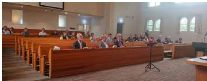
De jaaropening vond plaats in de Apeldoornse Barnabaskerk, waar een beperkt aantal mensen aanwezig kon zijn.

Door de omstandigheden rondom het coronavirus was het vorig studiejaar niet mogelijk in een gezamenlijke bijeenkomst het academisch jaar te openen. Dit jaar kon dat gelukkig wel, zij het met een beperkte groep aanwezigen.