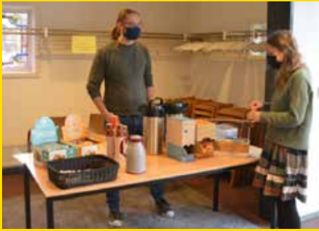
Studenten bemanden extra koffiepunten om de 1,5 meter afstand te kunnen handhaven.

De coronacrisis heeft het onderwijs – ook de TUA – veel geld gekost. Gelukkig heeft de overheid dat ook gezien, en komt zij met een financiële tegemoetkoming over de brug: de NPO-middelen, waarbij de letters NPO staan voor Nationaal Programma Onderwijs. In totaal gaat het voor het onderwijs in Nederland om 8,5 miljard euro, waarvan de TUA een bescheiden deel van zo'n € 145.000,- krijgt, verdeeld over 2021 en 2022.