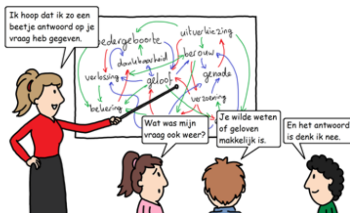
Cartoon: Jan Willem Klaassen