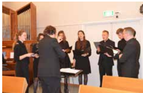
Tijdens de lezing over wat Johann Sebastian Bach zou antwoorden op de vraag "wie ben ik eigenlijk?" verzorgde de TUA-cantorij enkele mooie bijdragen.