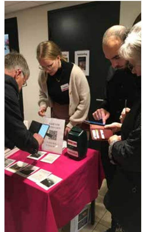
Drukte in de pauze bij de verkooftafel.