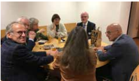
Er werd gegeten in groepjes verspreid over de hele TUA.