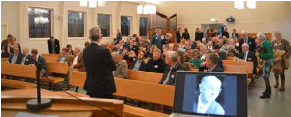
De hoofdcolleges vonden plaats in de aula van de TUA.

'Wie ben ik eigenlijk? Mens-zijn voor Gods aangezicht'. Dat was het thema van de TUA-dag die op vrijdag 3 november werd gehouden. We kijken terug op een dag waarop we een grote groep mensen mochten ontvangen voor een programma met inhoudsvolle colleges, workshops, zang door de cantorij, en natuurlijk werd er ook aan de inwendige mens gedacht. De onderlinge ontmoetingen waren hartelijk en de sfeer gemoedelijk. De eerstvolgende TUA-dag staat gepland voor vrijdagmiddag en -avond 1 november 2024. Ook dan bent u van harte welkom!