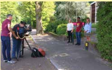
Eerstejaarsstudenten tijdens de opnames van de televisieprogramma's Hart van Nederland en RTL EditieNL. De reportages werden gemaakt naar aanleiding van de verdrievoudiging van het aantal inschrijvingen van nieuwe theologiestudenten.