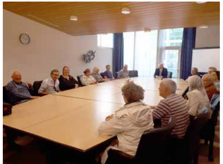
De Deense predikanten in de senaatskamer, de plek waar de admities-examens worden afgenomen.