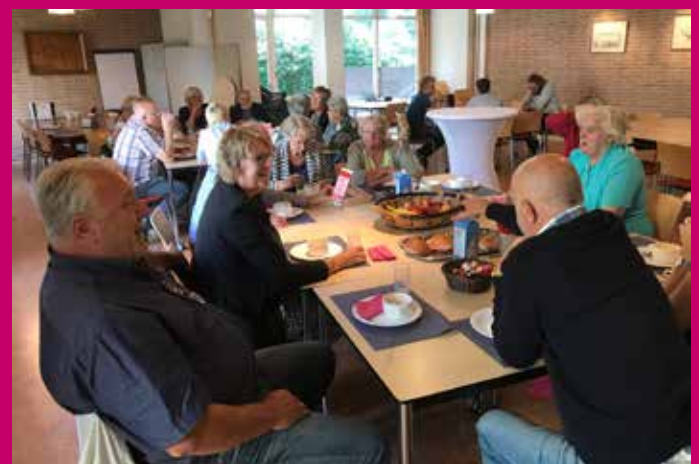
De groep uit Hasselt.