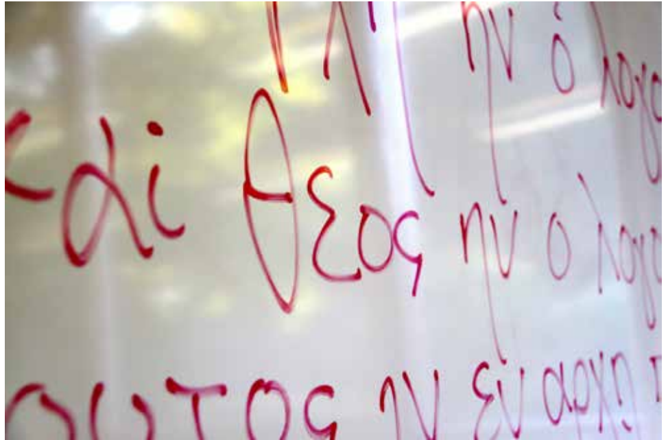
Grieks hoort bij de basisbagage van een theoloog.

Om de nieuwtestamentische tekst goed te kunnen begrijpen en uitleggen, is het van groot belang dat de student kennis heeft van het Grieks, de taal waarin het Nieuwe Testament geschreven is. De studenten die geen examen Grieks op de middelbare school hebben gedaan, krijgen gedurende het eerst studiejaar een groot deel van de Griekse grammatica op hun bordje. Daarnaast bouwen ze een woordenschat op, maken zij zich de belangrijkste onregelmatige werkwoordstijden eigen en leren ze eenvoudige Griekse teksten te vertalen. In het tweede studiejaar staat het vertalen van nieuwtestamentische teksten centraal en leren de studenten de bijzonderheden van het taaleigen van het nieuwtestamentisch Grieks. Er wordt niet alleen aandacht geschonken aan de Griekse tekst zelf, maar ook aan de verschillende vertalingen ervan. Zonder kennis van het Grieks is niet vast te stellen hoe de vertalers aan hun vertaling zijn gekomen en is men niet in staat zelf een keuze voor een bepaalde vertaling te maken. De studenten maken ook kennis met variante lezingen, die in verschillende manuscripten van het Nieuwe Testament voorkomen. Als iemand het Grieks niet beheerst, is het onmogelijk in te zien welke consequenties bepaalde varianten voor de vertaling van de tekst hebben.