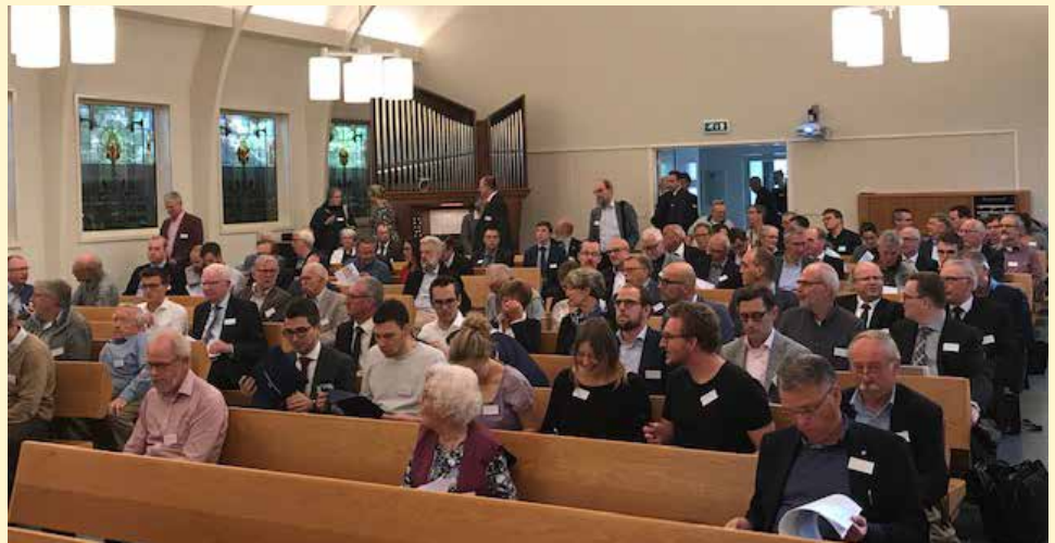
Het symposium draaide om de vraag of een predikant een werknemer is.

Is een predikant nu een werknemer? Dat is dus de vraag waar het bij het symposium om draaide. Er werden diverse lezingen gehouden, van zowel theologen, rechtsgeleerden als advocaten. Ik vond het boeiend om te merken hoe verschillend de insteek van de sprekers was. Zo benadrukten de theologen vooral de geestelijke instelling van het ambt